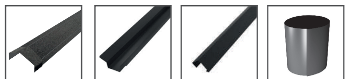
Caballete Recto Gravillado 430 mm